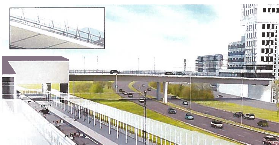
Visionsbild över Veddestabron. Vy från Barkarby med blick mot Barkarbystaden.

Veddestabron blir 30 meter bred, 530 meter lång och får fyra körfält, ett för buss och ett för bil i vardera riktning, samt gång- och cykelbana i vardera riktning. Till höger i bild skimtar man den nya entrén som ska byggas till den nya kollektivtrafikknutpunkten i Barkarby med nedgång till tunnelbana, bussterminal, pendeltåg och regionaltåg. På Veddestabron kommer bussar att stanna och det blir enkelt att byta till övrig kollektivtrafik. Den nya entrén öppnar i samband med att tunnelbanan tas i trafik. Till vänster på visionsbilden syns delar av framtida Barkarbystaden.